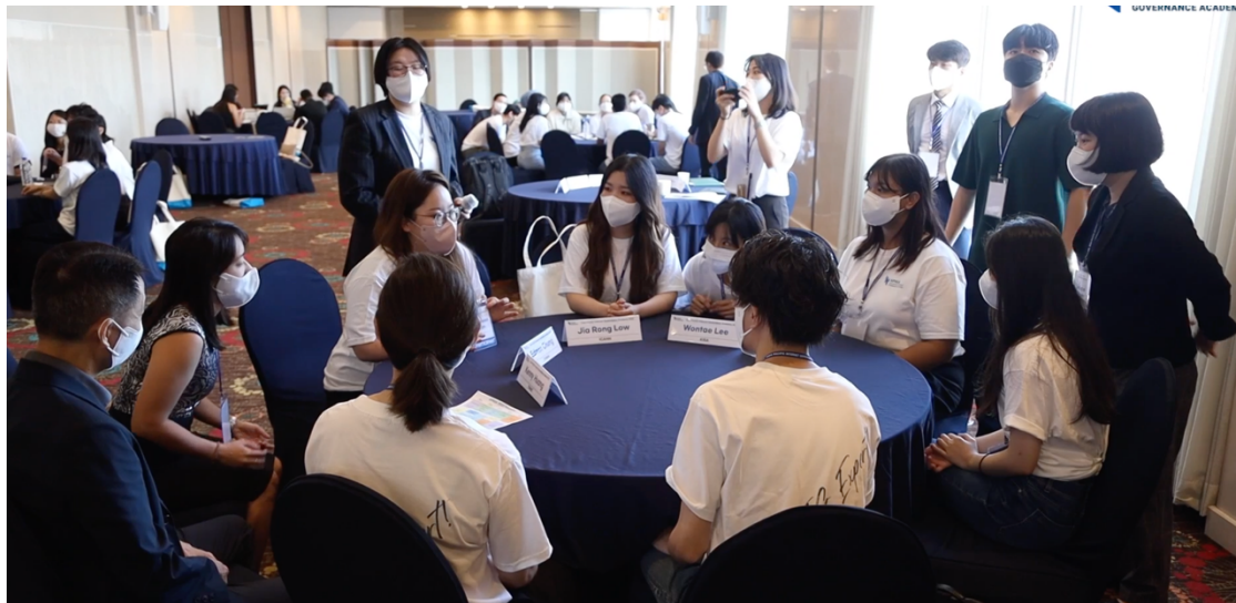
圖 1 APIGA2022 活動現場

本次出國訪問參與亞太網路治理學院，進行多方利害關係人模式課程規劃與培訓，依據最新的網路治理議題，包含網路不當內容治理、網路安全、單一網際網路等進行不同群體的跨群體討論。